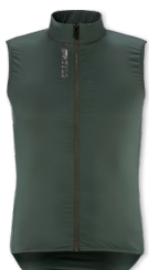
▶ T000345 CHRISTMAS GREEN