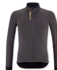
▶ T000348 CARBON