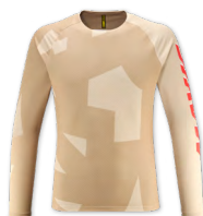
▶ T000489 WHITE PEPPER