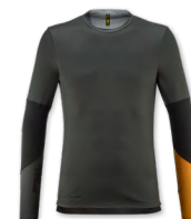
▶ T000481 MINERAL YELLOW