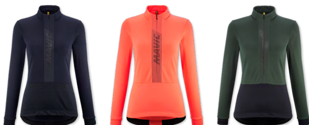
▶ T000369 DEEP BLUE