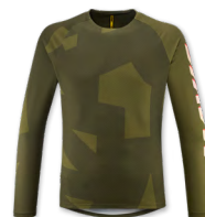
▶ T000487 BURNT OLIVE