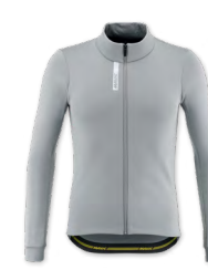
▶ T000376 SILVER