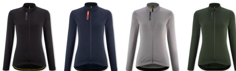
▶ T000340 BLACK