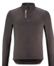
▶ T000378 CARBON