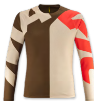
▶ T000484 DESERT PALM