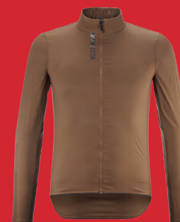
Ksyrium Thermo Jacket M