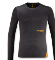
▶ T000533 BLACK