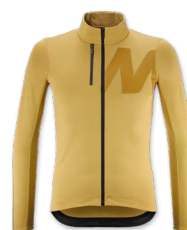
▶ T000386 GOLD