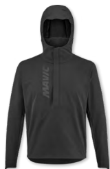
▶ T000655 BLACK