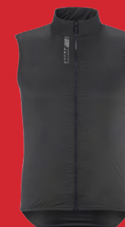
Ksyrium Thermo Vest M (auch für Frauen)