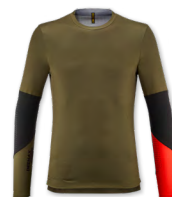
▶ T000478 OLIVE