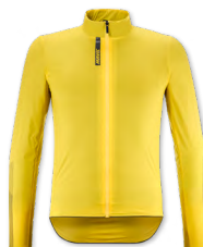
▶ T000379 YELLOW