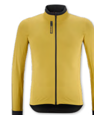
▶ T000389 GOLD