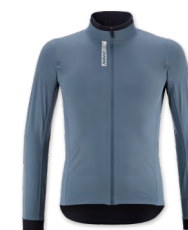
▶ T000387 ORION BLUE