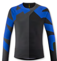
▶ T000482 IRON GATE