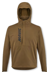
▶ T000656 DESERT PALM