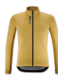
▶ T000377 GOLD