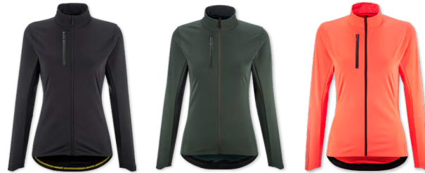
▶ T000396 BLACK