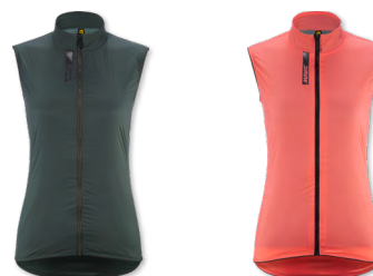
▶ T000399 CHRISTMAS GREEN