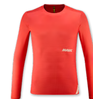
▶ T000531 SPICY ORANGE