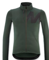
▶ T000347 CHRISTMAS GREEN