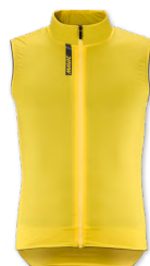
▶ T000382 YELLOW