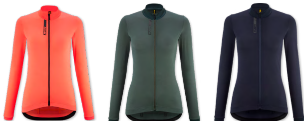
▶ T000339 CORAL