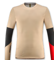
▶ T000479 SPICY ORANGE