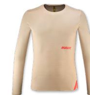
▶ T000534 WHITE PEPPER