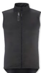
▶ T000380 BLACK