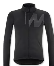
▶ T000384 BLACK