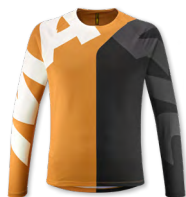
▶ T000483 MINERAL YELLOW