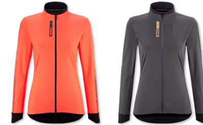
▶ T000393 CORAL