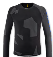
▶ T000488 IRON GATE