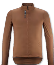
▶ T000344 BRONZE