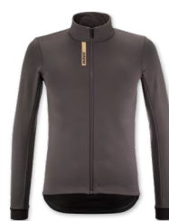
▶ T000343 CARBON