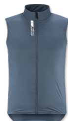
▶ T000381 ORION BLUE