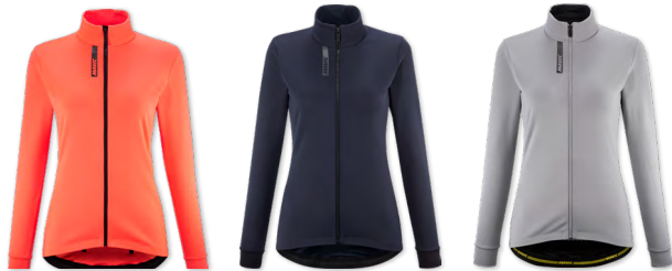
▶ T000390 CORAL