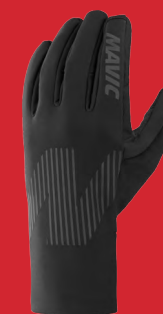
Ksyrium Alpha Glove