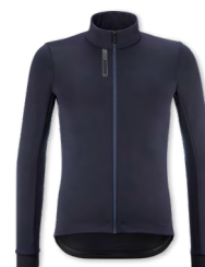
▶ T000375 DEEP BLUE