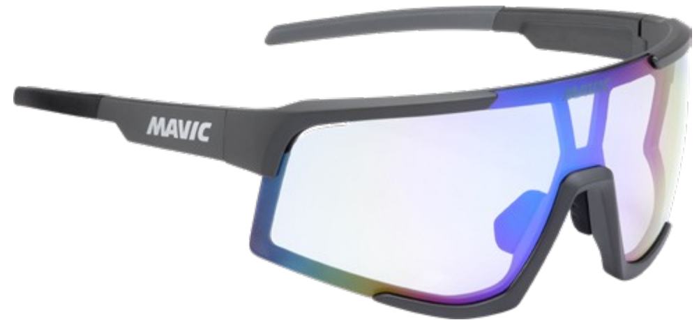
► G000512 ANTHRACITE BLUE PHOTOCHROMIC

Alle Gläser sind mit einer olephobischen Behandlung versehen, die eine einfache Reinigung ermöglicht und sie vor Kratzern schützt.