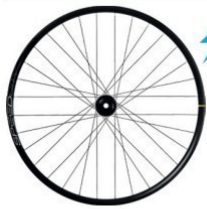
E-SPEEDCITY 1 700 Disc Maulweite 25mm 2105g 650B Disc Maulweite 30mm 2151g 329 €