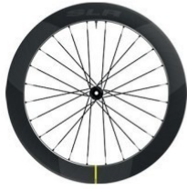
COSMIC SLR 65 Disc 1540g 2 249 €