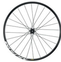
AKSIUM Disc 1905g Felgenbremse 1840g 299 €/329 €