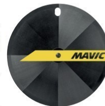
COMETE TRACK Tubular Vorderrad: 1010g Hinterrad: 1070g 2 249 €