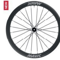
COSMIC SL 45 Disc 1555g 1 499 €