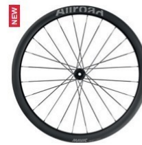
ALLROAD SL CARBON 700 Disc 1550g 650B Disc 1555g 1 499 €