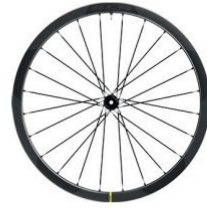
COSMIC SLR 32 Disc 1390g 2 249 €