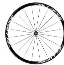
ELLIPSE Clincher 1895g 529 €