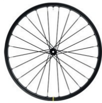
KSYRIUM SL Disc 1575g Felgenbremse 1480g 729 €/699 €