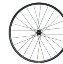
ALLROAD 700 Disc 1890g 650B Disc 1840g 329 €