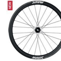
COSMIC S 42 DISC / 40 RB Disc 1660g Felgenbremse 1764g 999 €