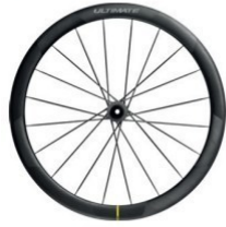
COSMIC ULTIMATE DISC Disc 1255g 4 449 €