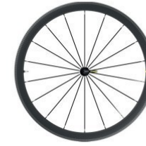
COSMIC SL 40 RBC Felgenbremse 1599g 1 499 €