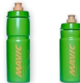
► G000010 ORGANIC GREEN ► G000009 ORGANIC GREEN