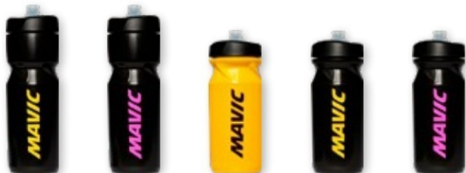
► G000024 BLACK ► G000030 LD ► G000021 YELLOW ► G000022 BLACK ► G000029 LD