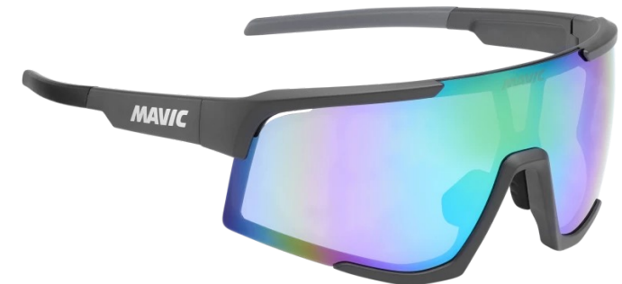
► G000506 ANTHRACITE GOLD BLUE