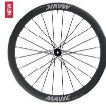
COSMIC SLR 45 Disc 1440g 2 249 €