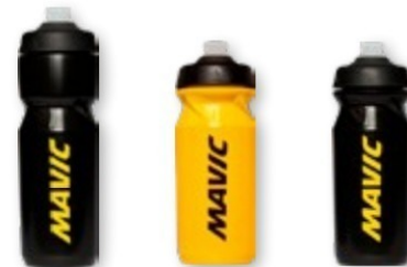
► G000028 BLACK ► G000025 YELLOW ► G000026 BLACK