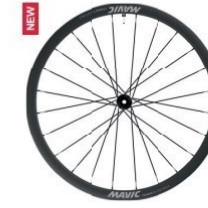
COSMIC SL 32 Disc 1475g 1 499 €