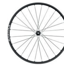
ALLROAD S 700 Disc 1790g 529 €