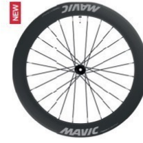
COSMIC SL 65 Disc 1853g 1 499 €