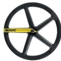
IO Tubular 750g 3 749 €