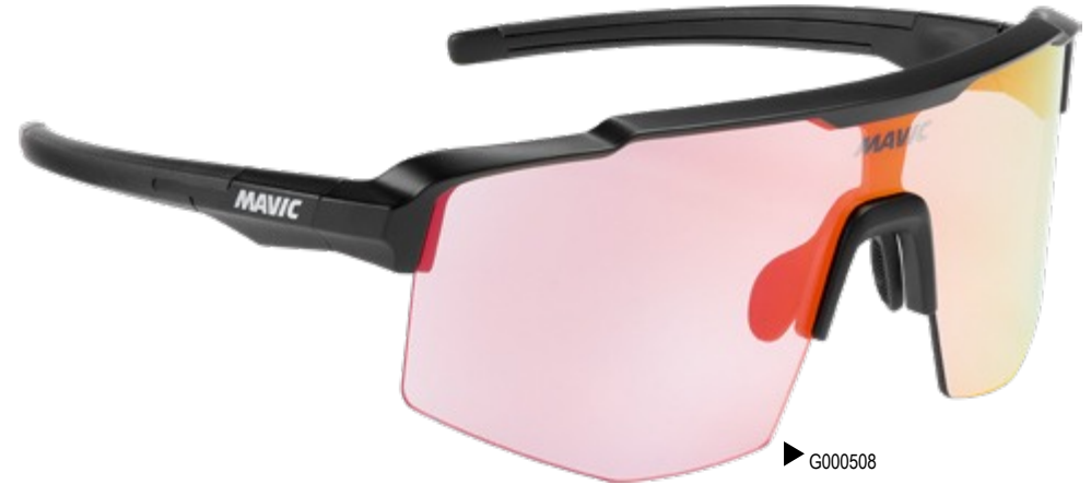
▶ G000508 BLACK RED PHOTOCHROMIC

Die photochromen Gläser ändern ihre Tönung je nach Lichtverhältnissen in wenigen Sekunden von CAT.1 auf 3. Sie werden sehen, das macht sie zur perfekten Wahl für wechselnde Lichtverhältnisse. Sichtbare Lichtdurchlässigkeit: 15% - 75% Alle Gläser bieten 100%igen UV-Schutz und sind mit einer olephobischen Behandlung versehen, die Staub und Schweiß abhält.