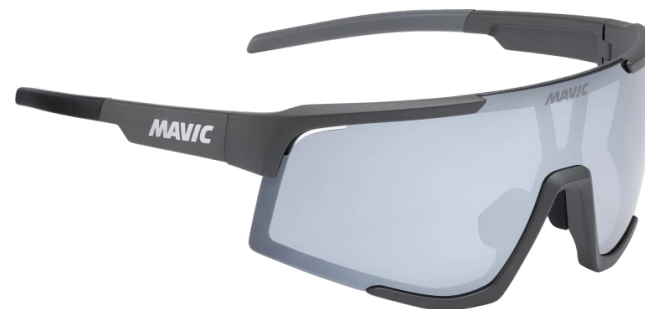
► G000511 ANTHRACITE SILVER